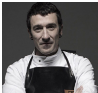
Eneko Atxa AZURMENDI 3*** Larrabetzu. Bizkaia

Originario del País Vasco, donde la gastronomía está profundamente arraigada en la cultura, Eneko Atxa ha conseguido desarrollar y desplegar su gran capacidad creativa en el complejo gastronómico Azurmendi. Sus raíces, el diálogo con su entorno inmediato y el recetario culinario tradicional vasco son los fundamentos de sus creaciones. Impulsado por la búsqueda de la excelencia, este chef invita a descubrir “su casa” para disfrutar con los cinco sentidos y que la experiencia sea memorable. Azurmendi ha obtenido tres estrellas Michelin, es una referencia gastronómica internacional y también ha sido distinguido con la Estrella Verde de Michelin a la sostenibilidad. En Larrabetxu, junto a su casa madre y la bodega Gorka Izaguirre, el restaurante Eneko ofrece un concepto cercano y divertido. En la misma línea gastronómica y de reciente creación, podemos disfrutar de Eneko Lisboa. En ambos establecimientos su cocina ha logrado el reconocimiento con una estrella Michelin.