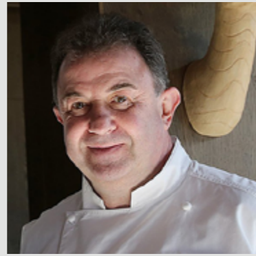
Martín Berasategui MARTÍN BERASATEGUI 3*** Lasarte-Oria. Guipúzcoa

Es el chef con más estrellas Michelin, 12 en total, del panorama gastronómico español: tres en el restaurante Martín Berasategui, en Lasarte, Guipúzcoa; otras tres en el restaurante Lasarte de Barcelona, dos en el MB de Tenerife, otra estrella en Oria, también en Barcelona, una en eMeBe Garrote en San Sebastián, otra en el restaurante Ola de Bilbao y una más en Fifty Seconds en Lisboa. Con más de 40 años de profesión, Martín Berasategui es uno de los cocineros más laureados, maestro de algunos de los grandes chefs de la actual cocina española y también asesor de más de una docena de establecimientos en todo el mundo.