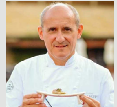
Paco Pérez MIRAMAR 2** Llançà. Gerona

“Expresar la emoción de los aromas marinos de una madrugada o extraer el alma de la tierra, del mar; descubrir la esencia de los sabores y las texturas”. Así explica Paco Pérez su propia cocina, porque ni él ni Miramar se pueden entender sin el entorno que los rodea: Llançà, el Cap de Creus, el mar Mediterráneo, la Tramontana y la tradición marinera. Los paisajes que el chef transforma en aromas, sabores y texturas de pura vanguardia. Su cocina parte de la tradición y del respeto por el producto más cercano llevado a la vanguardia más innovadora. Paco Pérez también dirige la propuesta gastronómica del restaurante Enoteca, de Barcelona, con dos Estrellas Michelin y del restaurante Cinc, de Berlín, con una estrella Michelin. Pero siempre, siempre, con Llançà y Miramar como puerto base.