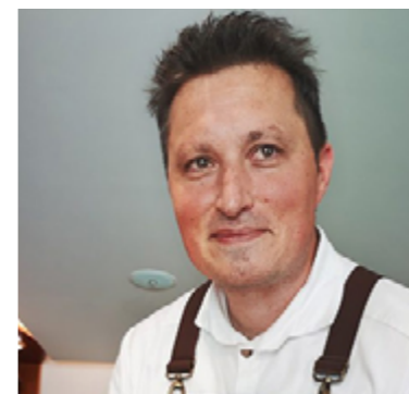
Kiko Moya L'ESCALETA 2** Cocentaina. Alicante

Este chef da forma a sus inquietudes en la cocina de El Portal del Echaurren. Un espacio peculiar y acogedor que fue la casa familiar y en el que actualmente Francis Paniego da rienda suelta a su poderosa creatividad. Su cocina tiene el carácter marcado por la tierra riojana y el entorno que la rodea y muestra la personalidad arrolladora de este chef. Enclavado en Ezcaray, uno de los pueblos más bonitos del norte de España, rodeados de naturaleza y bellos paisajes, El Portal ofrece una excelente oportunidad para degustar una gastronomía contemporánea con grandes influencias de la tradición, una cocina rica, sabrosa y contundente que no deja indiferente a nadie.