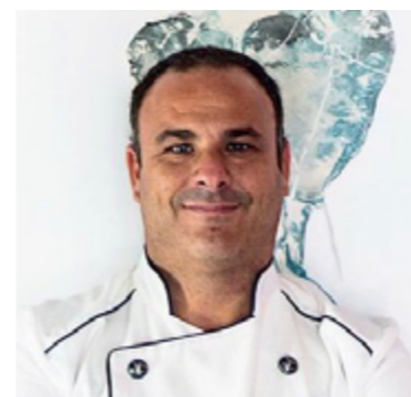
Ángel León APONIENTE 3*** Puerto de Santa María, Cádiz

Se aficionó al mar de pequeño, pescando con su padre, y se acercó a la cocina queriendo aprenderlo todo sobre el mar. Se formó en Francia y, tras su paso por diversos restaurantes en España, regresó a su tierra natal, Cádiz, para poner en marcha su propio restaurante. En la actualidad, Aponiente está enclavado en un espacio tan singular como un antiguo molino de mareas. El “chef del mar” es conocido en el panorama gastronómico gracias a un estilo centrado en productos marinos. Es el primer cocinero del mundo que ha desarrollado el plancton marino como ingrediente nutritivo para el consumo. La cocina marina de Ángel León se puede degustar en Aponiente, en el Puerto de Santa María, que cuenta con tres estrellas Michelin y también ha sido distinguido con la Estrella Verde de Michelin a la sostenibilidad. Alevante, situado en el complejo hotelero Meliá Sancti Petri en Chiclana, en el que también ha obtenido una estrella.