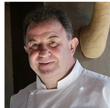
Martín Berasategui MARTÍN BERASATEGUI 3*** Lasarte-Oria. Guipúzcoa

Su carismática cocina creativa fluye de la Nueva Cocina Vasca. Este cocinero demuestra su enorme capacidad para asimilar y trabajar con nuevos productos con una gran precisión técnica, una profunda comprensión de los sabores y un gran respeto por los ingredientes.