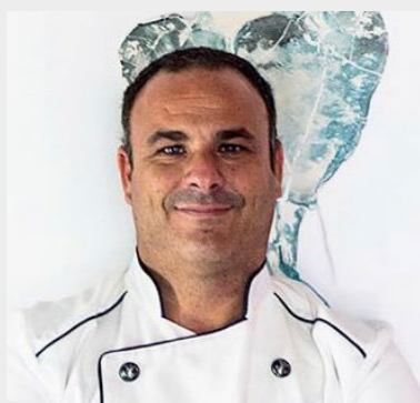
Ángel León APONIENTE 3*** Puerto de Santa María. Cádiz

Se aficionó al mar de pequeño, pescando con su padre, y se acercó a la cocina queriendo aprenderlo todo sobre el mar. Se formó en Francia y, tras su paso por diversos restaurantes en España, regresó a su tierra natal, Cádiz, para poner en marcha su propio restaurante. En la actualidad, Aponiente está enclavado en un espacio tan singular como un antiguo molino de mareas. El “chef del mar” es conocido en el panorama gastronómico gracias a un estilo centrado en productos marinos. Es el primer cocinero del mundo que ha desarrollado el plancton marino como ingrediente nutritivo para el consumo. La cocina marina de Ángel León se puede degustar en Aponiente, en el Puerto de Santa María, que cuenta con tres estrellas Michelin y también ha sido distinguido con la Estrella Verde de Michelin a la sostenibilidad. Alevante, situado en el complejo hotelero Meliá Sancti Petri en Chiclana, en el que también ha obtenido una estrella.