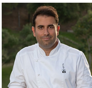
EL LAGO 1* Marbella. Málaga