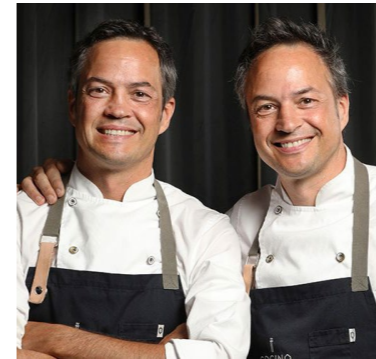
Hermanos Torres COCINA HERMANOS TORRES 2** Barcelona