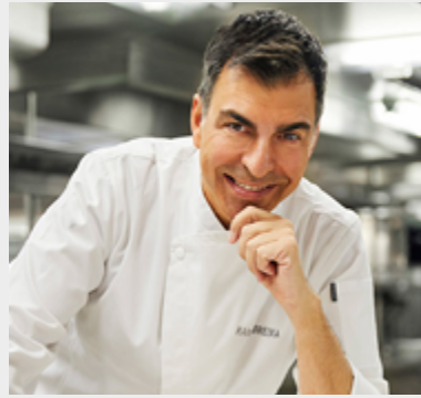
Ramón Freixa RAMÓN FREIXA 2** Madrid

El chef procede de una familia de restauradores catalanes y dirige el restaurante Ramón Freixa en Madrid, galardonado con dos estrellas Michelin. Ubicado en el Hotel Único, este proyecto gastronómico acaba de cumplir su décimo aniversario en la capital. En la cocina de Ramón Freixa hay atrevimiento, innovación y sensatez, una técnica impecable y numerosos juegos visuales y gustativos. En su apuesta culinaria conviven la tradición y la vanguardia, un punto de locura en contraste con una buena dosis de sentido común, y todos estos ingredientes unidos en perfecta armonía. Cada plato esconde una historia contada en secuencias, presentadas en composiciones de gran belleza estética, donde el protagonista siempre es el sabor.