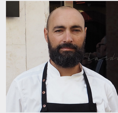
Benito Gómez BARDAL 2** Ronda. Málaga

Quique Dacosta es de origen extremeño y valenciano de adopción. Este chef empezó su incursión en la cocina muy joven y ya le gustaba indagar en los libros de los cocineros franceses que trabajaban en líneas culinarias diferentes a las que él conocía hasta ese momento. Así comienza también su afición a visitar los mejores restaurantes gastronómicos en España. En 1988 entra a trabajar en el que hoy es su restaurante, antes llamado El Poblet, que en sus inicios ofrecía una cocina castellana y que después dio un giro hacia una gastronomía basada en productos del mar y de proximidad. Ya bajo la dirección de Quique Dacosta se crea una cocina actualizada con nuevas técnicas, parte de los productos locales, como leitmotiv de su obra, pero siempre con una ventana abierta al mundo y a las culturas de otros países para enriquecer su propia cocina. Hoy Quique Dacosta tiene tres estrellas Michelin en el restaurante que lleva su nombre, su buque insignia situado en Denia, y dos estrellas en su propuesta valenciana en El Poblet.