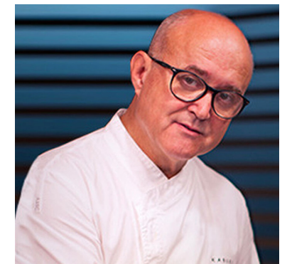
Ricardo Sanz KABUKI 1* Madrid

De la barra de Kabuki salieron los archiconocidos nigiris de huevo frito, de pez mantequilla y de hamburguesita con los que Ricardo Sanz fue pionero en “el cruce de caminos” entre la cocina japonesa y mediterránea que bullía en su cabeza. Con estos nigiris empezó lo que ahora conocemos como la Cocina Kabuki. Y si hay algo que define su cocina es la fusión: “Mi trabajo consiste en coger lo mejor de dos mundos gastronómicos, el japonés y el mediterráneo, y llevárselo a nuestros clientes, siempre con un gran respeto”. Este chef ha logrado que tres de sus restaurantes ostenten la tan preciada estrella Michelin.