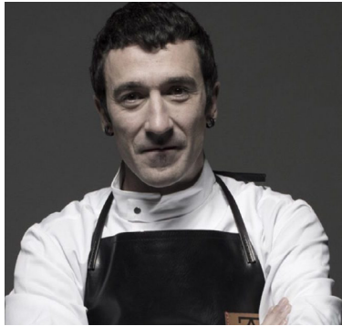
Eneko Atxa AZURMENDI 3*** Larrabetzu. Bizkaia

Originario del País Vasco, donde la gastronomía está profundamente arraigada en la cultura, Eneko Atxa ha conseguido desarrollar y desplegar su gran capacidad creativa en el complejo gastronómico Azurmendi. Sus raíces, el diálogo con su entorno inmediato y el recetario culinario tradicional vasco son los fundamentos de sus creaciones. Impulsado por la búsqueda de la excelencia, este chef invita a descubrir “su casa” para disfrutar con los cinco sentidos y que la experiencia sea memorable. Azurmendi ha obtenido tres estrellas Michelin y es una referencia gastronómica internacional. También en Larrabetzu, junto a su casa madre y la bodega Gorka Izaguirre, el restaurante Eneko ofrece un concepto cercano y divertido. En la misma línea gastronómica y de reciente creación, podemos disfrutar de Eneko Bilbao. En ambos establecimientos su cocina ha logrado el reconocimiento con una estrella Michelin.