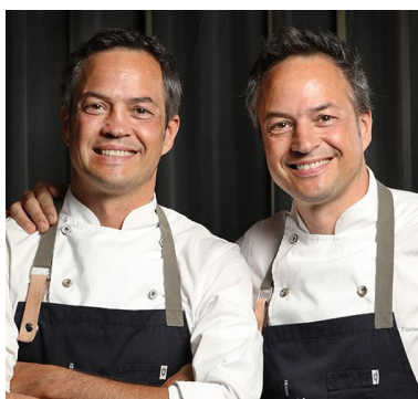
Hermanos Torres COCINA HERMANOS TORRES 2** Barcelona

El nuevo concepto de restaurante de los gemelos Torres, Sergio y Javier, es su apuesta más personal. En Cocina Hermanos Torres los fogones se integran totalmente en la sala del restaurante, para que los comensales vivan una experiencia diferente como espectadores. En su oferta gastronómica plantean un recetario creativo con guiños a sus viajes y a los recuerdos de su infancia siempre teniendo como base la tradición y los mejores productos de temporada.