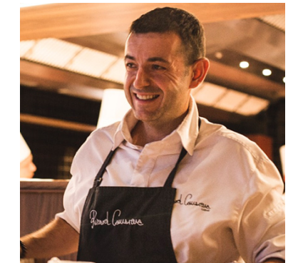
Ricard Camarena RICARD CAMARENA RESTAURANT 2** Valencia

En Paco Roncero Restaurante este chef nos descubre el “cielo” de Madrid junto a una oferta gastronómica original y creativa que invita a disfrutar de nuevas impresiones culinarias. Un concepto vanguardista y moderno en el que Paco Roncero nos permite disfrutar de las diferentes texturas, colores y sabores de sus platos. Un chef inquieto que defiende la cocina dentro de un estilo de vida saludable y asesora más de una docena de proyectos gastronómicos en todo el mundo y todos ellos concebidos como experiencias sensoriales para sus clientes.