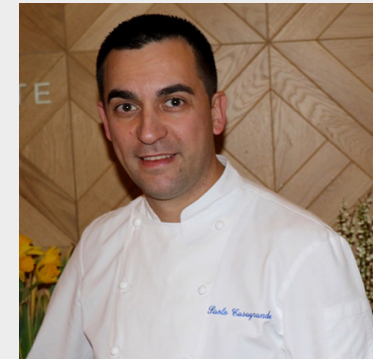
Paolo Casagrande LASARTE 3*** Barcelona

Originario del País Vasco, donde la gastronomía está profundamente arraigada en la cultura, Eneko Atxa ha conseguido desarrollar y desplegar su gran capacidad creativa en el complejo gastronómico Azurmendi. Sus raíces, el diálogo con su entorno inmediato y el recetario culinario tradicional vasco son los fundamentos de sus creaciones. Impulsado por la búsqueda de la excelencia, este chef invita a descubrir “su casa” para disfrutar con los cinco sentidos y que la experiencia sea memorable. Azurmendi ha obtenido tres estrellas Michelin y es una referencia gastronómica internacional. También en Larrabetzu, junto a su casa madre y la bodega Gorka Izaguirre, el restaurante Eneko ofrece un concepto cercano y divertido. En la misma línea gastronómica y de reciente creación, podemos disfrutar de Eneko Bilbao. En ambos establecimientos su cocina ha logrado el reconocimiento con una estrella Michelin.