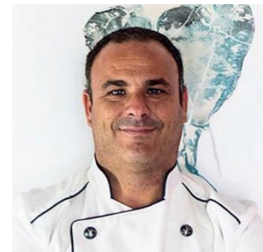
Ángel León APONIENTE 3*** Puerto de Santa María. Cádiz

Se aficionó al mar de pequeño, pescando con su padre, y se acercó a la cocina queriendo aprenderlo todo sobre el mar. Se formó en Francia y, tras su paso por diversos restaurantes en España, regresó a su tierra natal, Cádiz, para poner en marcha su propio restaurante. En la actualidad, Aponiente está enclavado en un espacio tan singular como un antiguo molino de mareas. El “chef del mar” es conocido en el panorama gastronómico gracias a un estilo centrado en productos marinos. Es el primer cocinero del mundo que ha desarrollado el plancton marino como ingrediente nutritivo para el consumo. La cocina marina de Ángel León se puede degustar en Aponiente, en el Puerto de Santa María, que cuenta con tres estrellas Michelin y también ha sido distinguido con la Estrella Verde de Michelin a la sostenibilidad. Alevante, situado en el complejo hotelero Meliá Sancti Petri en Chiclana, en el que también ha obtenido una estrella.