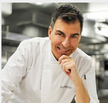
Ramón Freixa RAMÓN FREIXA 2** Madrid

El chef procede de una familia de restauradores catalanes y dirige el restaurante Ramón Freixa en Madrid, galardonado con dos estrellas Michelin. Ubicado en el Hotel Único, este proyecto gastronómico acaba de cumplir su décimo aniversario en la capital. En la cocina de Ramón Freixa hay atrevimiento, innovación y sensatez, una técnica impecable y numerosos juegos visuales y gustativos. En su apuesta culinaria conviven la tradición y la vanguardia, un punto de locura en contraste con una buena dosis de sentido común, y todos estos ingredientes unidos en perfecta armonía. Cada plato esconde una historia contada en secuencias, presentadas en composiciones de gran belleza estética, donde el protagonista siempre es el sabor.